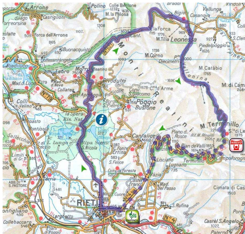
Planimetria Percorso crono tratto blu. Percorso di ritorno tratto puntinato.

Dislivello da superare mt. 1805 Punto int.: Ternana x Morro Reatino